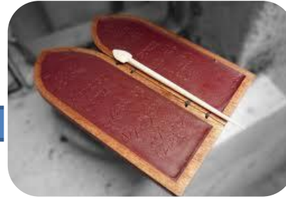
Tablillas de cera