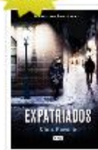
EXPATRIADOS CHRIS PAVONE