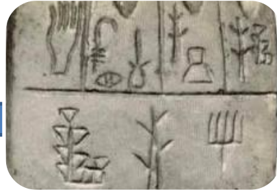
Tablilla de arcilla