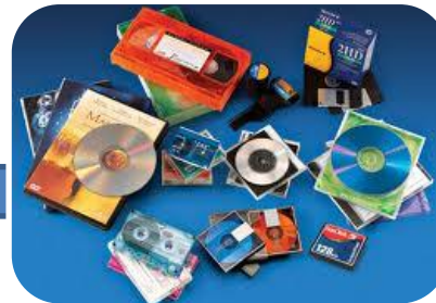
Dispositivos de almacenamiento